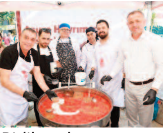
Birlik ve dayanışma vurgusu ■ 8'de