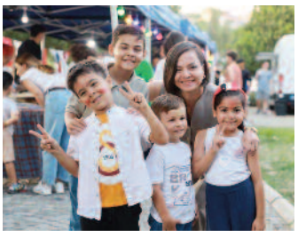
Karabağlar'da mutlu çocuklar ■ 8'de