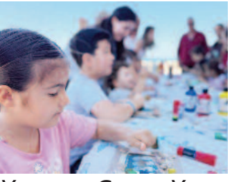
Yuvamız Çeşme Yaz Atölyeleri ■ 8'de