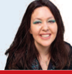
TUĞÇE YERDELEN “Efsaneler yaşasaydı”

Kadir İnanır bugün aramızda olsaydı hangi konularda konuşurdu? Bu sorunun yanıtı, yıllar önce verdiği röportajlarda saklı. Çocuk özleminden toplumsal sorumluluğa, ekonomiden sanata ve inanca uzanan sözleri; değişen zamanlara rağmen güncelliğini koruyor. Cuma günü aramızdan ayrılan usta sanatçı, “Ben cebimi doldurup köşeme çekilmedim” derken, geride bırakmak istediği mirası da tek cümlede özetliyor: “Arkamdan 'Helal olsun Kadir Abi'ye desinler.”