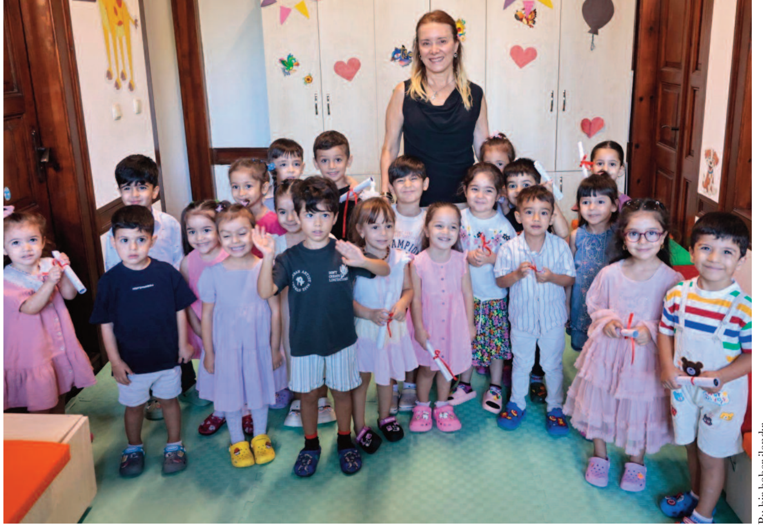
Bu bir haber illandır.