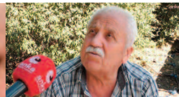
Emekli vatandaş "Emeklilerle oyun oynanıyor, dalga geçiliyor" diye yakındı.

Aylıkları 6 aylık dönemde enflasyon oranında artan SSK ve Bağ-Kur emeklileri için 5 ay sonunda kesilen oran yüzde 16,60 oldu. Haziran enflasyonu ile birlikte bu oranın yüzde 17 ile 18 arasında değişmesi bekleniyor. Bu da en düşük emekli aylığında 3 bin 500, 3 bin 600 lira civarında artışa denk geliyor. Görüşlerini açıklayan bir emekli "Emeklilerle oyun oynanıyor, dalga geçiliyor" diye yakınırken bir başkası seyyanen zam olmadıkça emekliyi hiçbir şeyin kurtarmayacağını belirterek, "Yüzde 18 ile o iş olmaz" görüşünü dile getirdi. Bir emekli sağlık hizmetlerinden yakındı ve "Dişlerimi yaptıramıyorum. Sigortaya gittim, rezillik. Özele gideceğim mecburen, yoksa yapılmıyor. Git gel 2 aydır uğraşıyorum, 2 dişimi çektiremedim. En sonunda özele gittim çektiler" dedi.