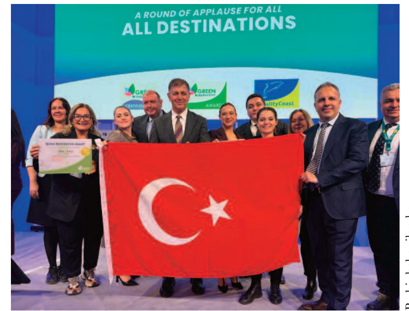
Bu bir haber illandır.

Tarihi Hava Gazı Fabrikası, Tarihi Asansör, APİKAM ve Kültürpark Pakistan Pavyonu'nun Avrupa Endüstriyel Miras Rotası'na dahil edilmesiyle İzmir'in uluslararası görünürlüğü arttı. İzmir'in çok katmanlı kültürel mirasının önemli simgelerinden biri olan Aziz Polycarp'ın anısını yaşatmak amacıyla hazırlanan Aziz Polycarp Anı Alanı da Kadifekale'de ziyaretçilerin erişimine açıldı.