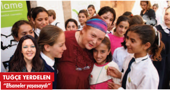
TUĞÇE YERDELEN "Efsaneler yaşasaydı"

► "13 ay yüzüstü yattım ama üretmekten vazgeçmedim" diyen Türkan Saylan, yaşamını yalnızca hastalıklarla değil; önyargılarla, yoksullukla ve eğitim eşitsizliğiyle mücadeleye adadı. Binlerce kız çocuğunun eğitimine destek verdi... ● 8'de