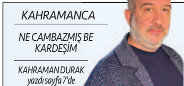
KAHTAMANCA NE CAMBAZMIŞ BE KARDEŞİM KAHTAMAN DURAK yazdı sayfa 7'de

► Yaza fit vücutla girmekte gecikenler çareyi şok diyetlerde arıyor. Bunun için internette duyurulan formüllere yönelenler, hastalanma tehlikesi ile karşı karşıya. Her vücudun beslenme formülünün kendine has olduğunu söyleyen uzmanlar, öğün atlama, kontrolsüz detoks ve karbonhidratı tamamen kesmenin kas ve su kaybına neden olduğunu, vücudun her koşulda karbonhidrata ihtiyaç duyduğunu uyarısını yaptı. ● 2'de