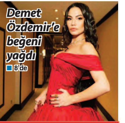
Demet Özdemir'e beğeni yağdı ■ 8'de