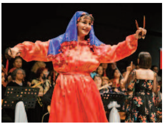
Kaşıkların ritmi yankılandı ■ 8'de