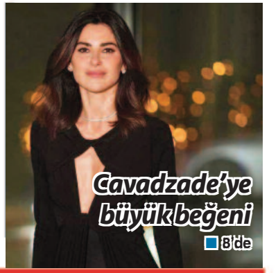
Çavdazade'ye büyükbeğeni ■ 8'de