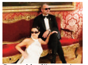
Roma'da dünyaevine girdiler ■ 8'de

ÖZEL, CHP'DE YAŞANAN SÜRECİ DEĞERLENDİRİRKEN MERHUM KADİR İNANIR'A GÖNDERME YAPTI