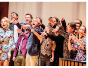
Sanatın kalbi AASSM'de atacak ■ 8'de