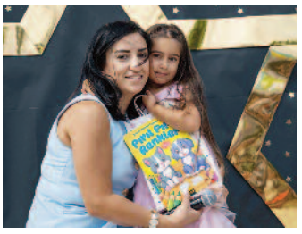
Bornova'da geleceğin yıldızları mezun oldu ■ 8'de