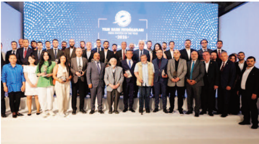
Foto Muhabirleri Derneği'nin 2026 Yılın Basın Fotoğrafları Ödül Töreni'nde, Özgür Özel'in, Ferdi Zeyrek'in mezarında çekilen fotoğrafı "Yılın Haber Fotoğrafı" seçildi. Burada konuşan Özgür Özel, "Hayatımın en zor anında çekilmiş bir resim olarak keşke Orkun o resmi hiç çekmeseydi, keşke ben o resmin öznesi olmasaydım, keşke o veda olmasaydı" dedi.

Foto Muhabirleri Derneği'nin 2026 Yılın Basın Fotoğrafları Ödül Töreni Cermodem'de gerçekleştirildi. Seçilmiş CHP Genel Başkanı Özgür Özel de 2026 Yılın Basın Fotoğrafları Ödül Töreni'ne katıldı. Özel'e, Adana Milletvekili Burhanettin Bulut ve Çankaya Belediye Başkanı Hüseyin Can