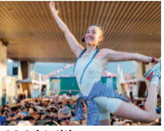
400 kişilik yoga buluşması ■ 8'de