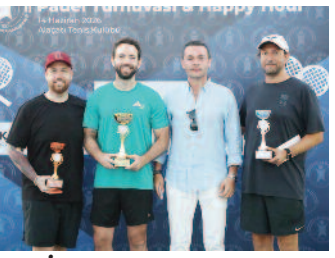
EGİAD üyeleri, yaz enerjisiyle buluştu. ■ 8'de