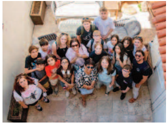
Kuşadası ile Marlı arasında gençlik köprüsü ■ 8'de