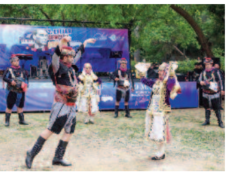
Efeler'de vatandaşlar sanata doycak ■ 8'de