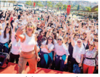
Konak'tan Anneler Günü dansı ■ 8'de