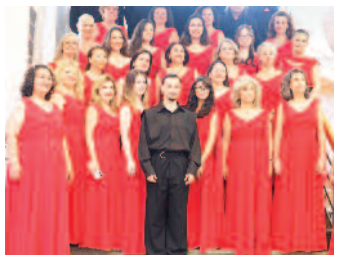
AASSM'de koristler göz kamaştırdı ■ 8'de