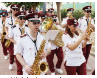
Çiğli'de 'Engelsiz Şenlik' ■ 8'de