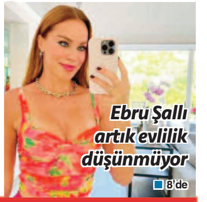
Ebru Şallı artık evlilik düşünmüyor ■ 8'de

KILIÇDAROĞLU'NUN GENEL BAŞKANLIĞA DEVAM ETMESİ KARARLAŞTIRILDI