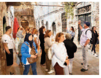
Kemeraltı'nın tarihini incelediler ■ 8'de