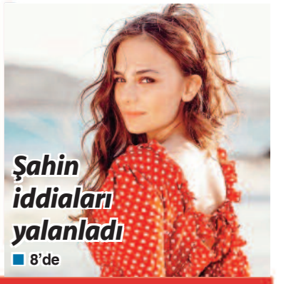
Şahin İddiaları yalanladı ■ 8'de