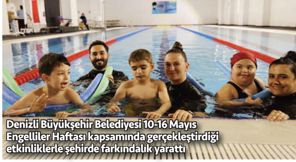
Denizli Büyükşehir Belediyesi 10-16 Mayıs Engelliler Haftası kapsamında gerçekleştirdiği etkinliklerle şehirde farkındalık yarattı

Denizli Büyükşehir Belediyesi tarafından Engelsiz Spor Yaşam Merkezi'nin ev sahipliğinde özel bir program gerçekleştirildi. Düzenlenen yüzme şenliği, spor şenliği ve "EngelsizFest" etkinlikleri, özel gereksinimli bireyler ve ailelerine unutulmaz anlar yaşattı.