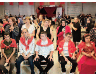
Engellilere asker kınası gecesi ■ 8'de