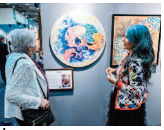
İzmir'de büyük sanat buluşması ■ 8'de