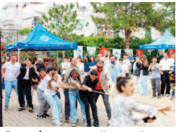
Gençler sınav öncesi moral depoladı ■ 8'de