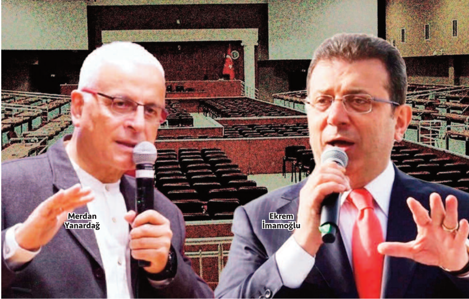
Ekrem İmamoğlu, Merdan Yanardağ ve Necati Özkan, "casusluk" davasında dün ilk kez hakim karşısına çıktılar. Savunma yapan İmamoğlu, Cumhurbaşkanı Recep Tayyip Erdoğan ile MHP lideri Devlet Bahçeli'ye çağrıda bulunarak, "Bu bir hukuk katlidir" dedi.

GÜN , savunmasında "Ben sayın Ekrem İmamoğlu'nu hayatımda bir kere gördüm. İmamoğlu'nu yaptığımız tebrik ziyaretinde görmüştüm ilk olarak. İkinci olarak da burada görüyorum" dedi. Ekrem İmamoğlu da, "Ekrem İmamoğlu'nu, Necati Özkan'ı, Merdan Yanardağ'ı casuslukla suçlamak; hukukla, aklıla, vicdanla açıklanabilecek bir şey değildir. Bu artık aklın ve ciddiyetin tamamen terk edilmesidir" ifadelerini kullandı. ■ 4'te