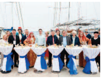
Bodrum'da dostluk köprüsü kuruldu ■ 8'de