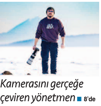
Kamerasını gerçeğe çeviren yönetmen ■ 8'de