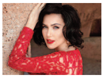
Sam'dan iddialara yanıt ■ 8'de