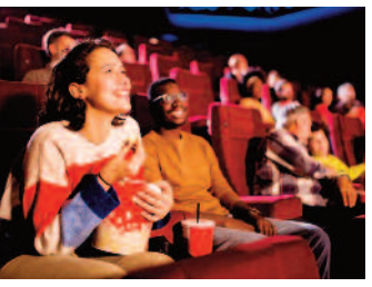
Yeniden Sinematek gösterimleri başlıyor ■ 8'de