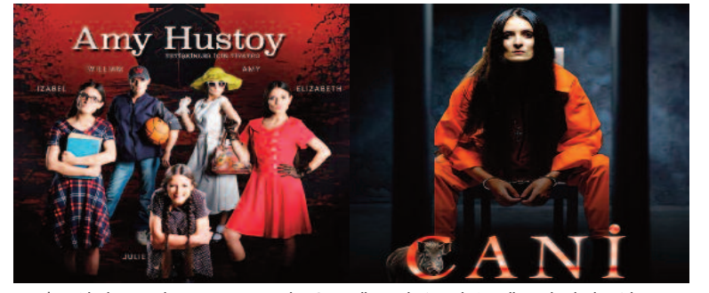
Izmir'de ikamet eden tüm tiyatroseverleri Cami adlı oyunla Amerika'nın ilk seri katili olan Aileen Wuornos'un gerilim dolu hikayesine, Amy Hustoy adlı oyunla çoklu kişilik bozukluğuna sahip bir kadının tüm alter kişilikleri ile tanışıp trajikomik türden hikayesine şahit olmaya ve Heykele Fıslıdayan Kadın 'Camille Claudel' ile de Camille'in sarı ve çarpıcı hayat hikayesine şahitlik etmeye bekliyoruz.