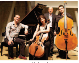
AASSM, ilkbaharı sanatla uğurluyor ■ 8'de