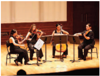
Tecrübeli sanatçılar sahnede ■ 8'de