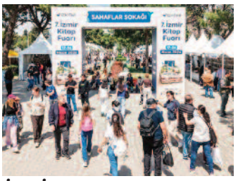
İZKİTAP'ta edebiyat şöleni yaşandı ■ 8'de