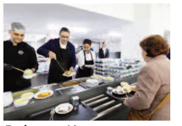
Balçova, Kent Lokantası 1yaşında ■ 3'te