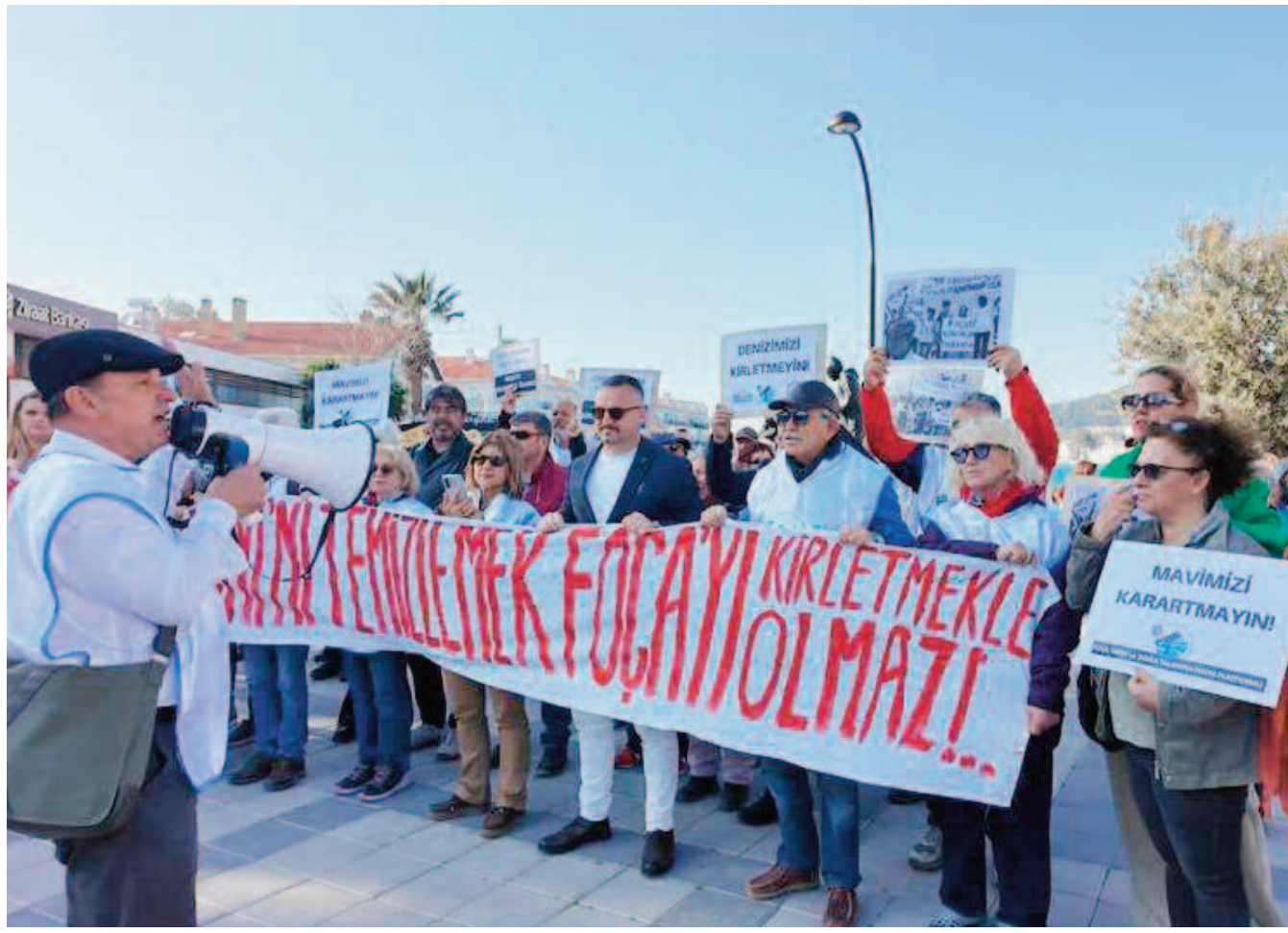
Foça Tarih ve Doğa Talanına Hayır Platformu üyeleri, düzenledikleri eylemlerde kaş yaparken göz çıkarılmamasını istedi. Platform ayrıca Mayıs ayında sorunu masaya yatırarak çözmek için bir panel gerçekleştirmeyi hedefliyor.

Foça Tarih ve Doğa Talanına Hayır Platformu, Körfez dip çamuruna hayır demek için önce insan zinciri oluşturdu. Ardından iki ilçede eş zamanlı imza kampanyası başlattı