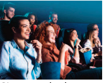
Sinema salonları hareketleniyor ■ 2'de