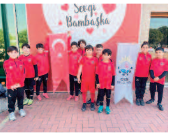
Geleceğin futbolcuları Çiğli'de yetişiyor ■ 8'de