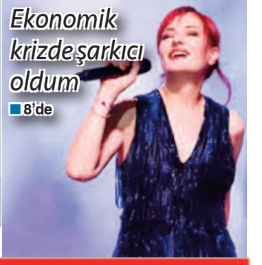
Ekonomik krizde şarkıcı oldum ■ 8'de