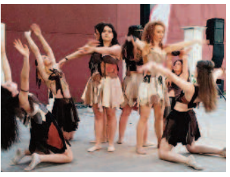
Yeşilova Höyüğü'nde felsefe canlandı ■ 8'de