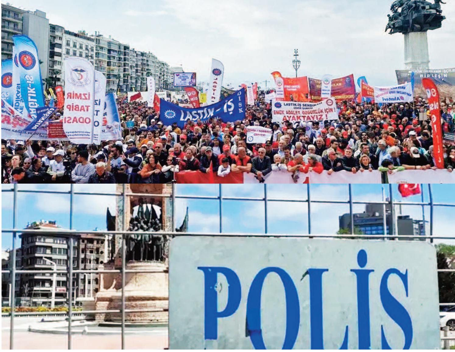
İstanbul Valiliği 1 Mayıs Emek ve Dayanışma Günü kapsamında Kadıköy ve Kartal'da kutlamalara izin verildiğini duyurdu. Beyoğlu, Şişli, Fatih ve Beşiktaş'ta ise gün boyunca her türlü eylem ve etkinlikler yasaklandı. Taksim Meydanı da daimi yasaklı konumunu bu yıl da korudu.

1 Mayıs programı saat 16.00'da sona erecek. Ayrıca Türkiye Komünist Partisi (TKP), 1 Mayıs için Bostanlı Demokrasi Meydanı'nda saat 15.00'te ayrı bir etkinlik düzenleyecek. Bu yılın 1 Mayıs sloganı, "Savaşa ve sömürüye karşı adalet, özgürlük ve eşitlik için 1 Mayıs" olarak açıklandı. Kutlamalar öncesi kent genelinde güvenlik önlemleri artırıldı. Emniyet birimleri çok sayıda personel görevlendirirken, kritik noktalara bariyerler yerleştirildiği görüldü. Mitinge girişlerin arama noktalarında yapılabileceği belirtildi.