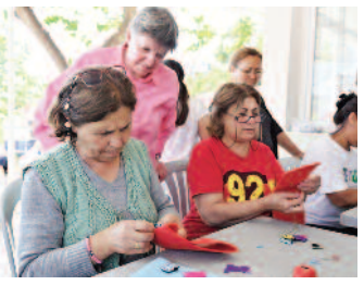
'Kadın Buluşmaları' güçleniyor ■ 8'de