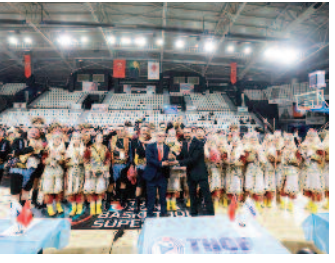
Halk oyunlarına Manisa damgasını vurdu ■ 8'de