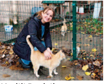
Kedili Park ile can dostlara güvende ■ 8'de