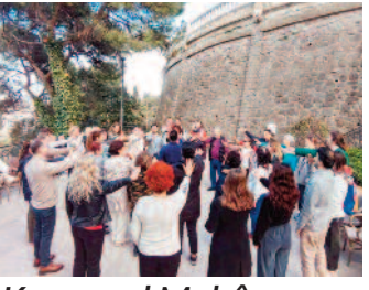
Kamusal Mekân Söyleşileri ■ 8'de