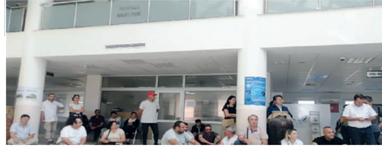
Tazminatsız işten çıkarılan işçiler belediye önünde birçok kez eylem yapmış, zaman zaman polisin biber gazlı müdahalesine de maruz kalmıştı. İşçiler 10 aydır haklarını istiyor.